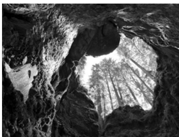
Table des matières et commande : http://www.s-n-g.ch/spip.php?article259

« Les territoires occidentaux ont connu des transformations majeures ces dernières décennies : l'usage croissant de la voiture particulière, le maillage routier et autoroutier toujours plus serré, la construction d'infrastructures ferroviaires à grande vitesse ou encore les offres low-cost dans le transport aérien. Nous sommes également dans un contexte de montée des préoccupations environnementales, qui suggère la nécessité d'adopter des modes de vie plus sobres du point de vue des consommations énergétiques. Alors que les villes s'étalent, les centres urbains denses redeviennent attractifs et la marche et le vélo reprennent une place qu'ils avaient laissée vacante pendant des décennies. Pour autant, au-delà de ces territoires centraux, les flux automobiles continuent de s'accroître. Quelle place la proximité a-t-elle dans ces territoires à plusieurs vitesses ?